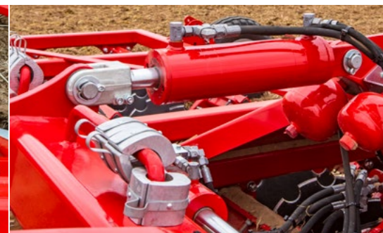
Joker RT Classic mit SoftRide System