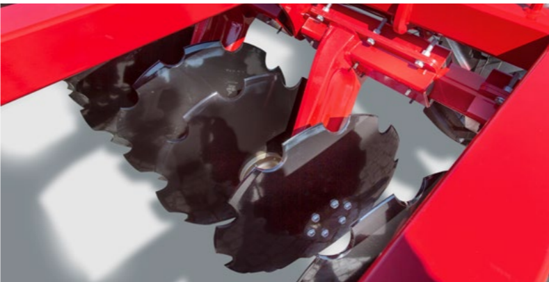
Große (Ø 52 cm) Scheiben für tiefes Arbeiten