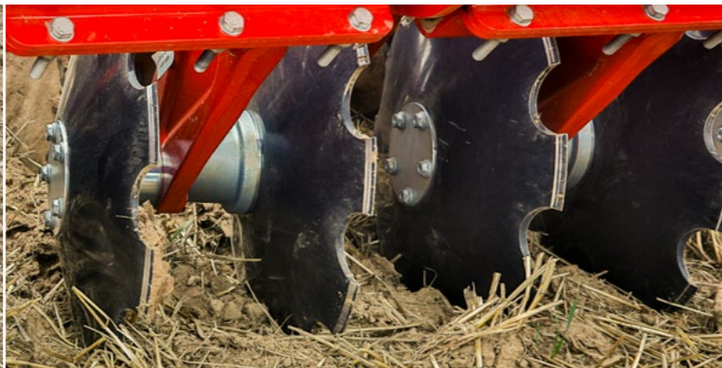
Hoher Durchgang – zwei Scheiben an einem Arm