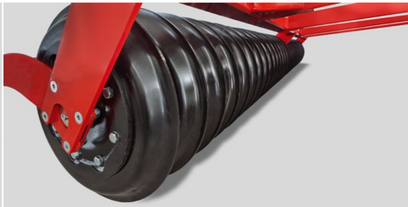
Geschlossener SteelDisc Packer mit schneidenden Packerringen