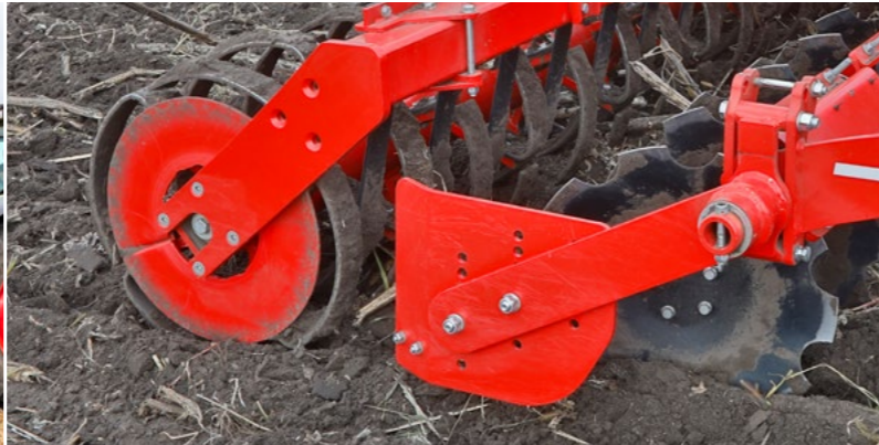
Seitenbegrenzung für randscharfes Arbeiten