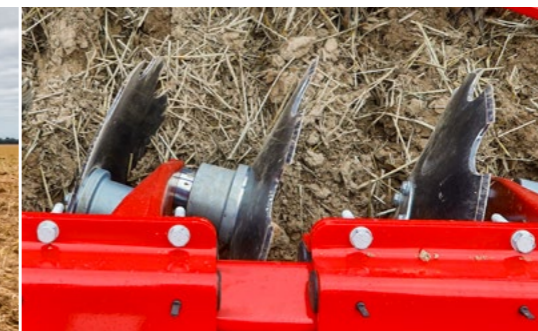
Maximaler Durchgang durch paarweise Scheibenanordnung