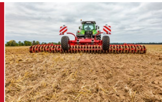
Die Joker hinterlässt einen feinkrümeligen, rückverfestigten Boden mit besten Auflaufbedingungen.