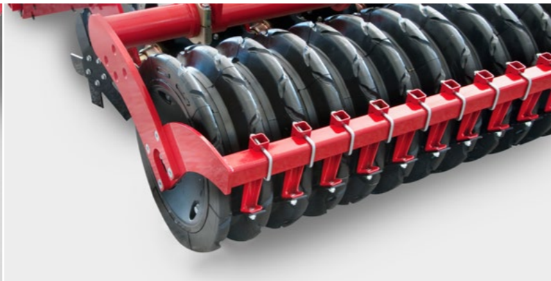
Der FarmFlex Packer verfügt über effektive und robuste Abstreifer für einen störungsfreien Lauf.