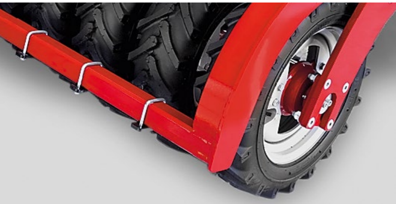
Walkfähiger Reifenpacker mit AS Profil