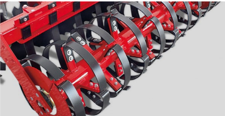
Rollflex Packer mit Packerelementen aus Federstahl