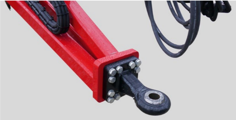
Zugpendelhängung mit Zugöse (Kugelgelenk)