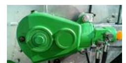
MZ60 à MZ80T

L'ensemble des épandeurs à fumier sont équipés d'une transmission directe constituée d'un arbre à transmission et d'un boîtier central aux dimensions généreuses entraînant le mécanisme d'épandage. La transmission monobloc à un grand volume d'huile cela garantit une longue durée de vie.